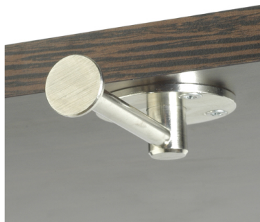
Fourni avec 4 vis à bois 3.5x16