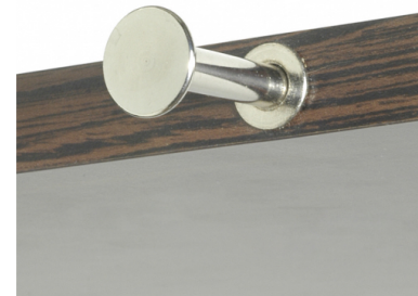
Fourni avec ou sans usinage Perçage Ø14mm